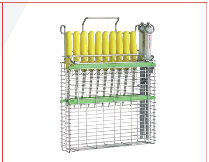
ITEC Messerhalter Typ 22200