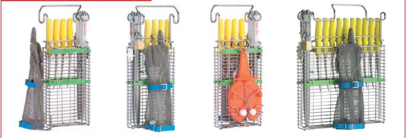
ITEC Messerhalter Typ 22240/22200