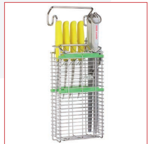
ITEC Messerhalter Typ 22240